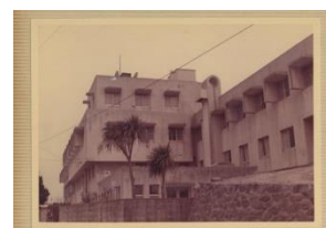
創立当時の写真です☆